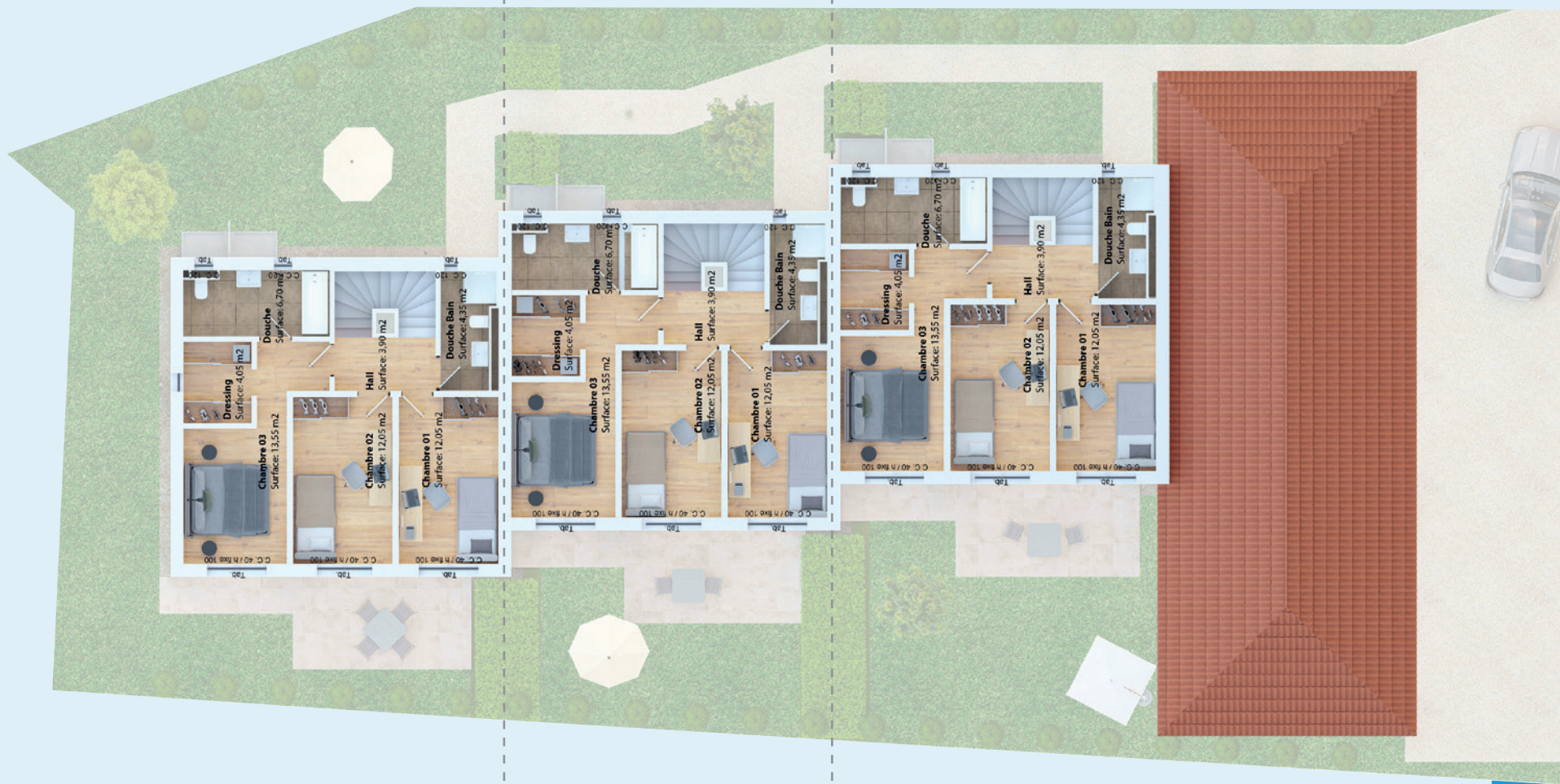
Villa A Etage Surface PPE = 77.75 m 2