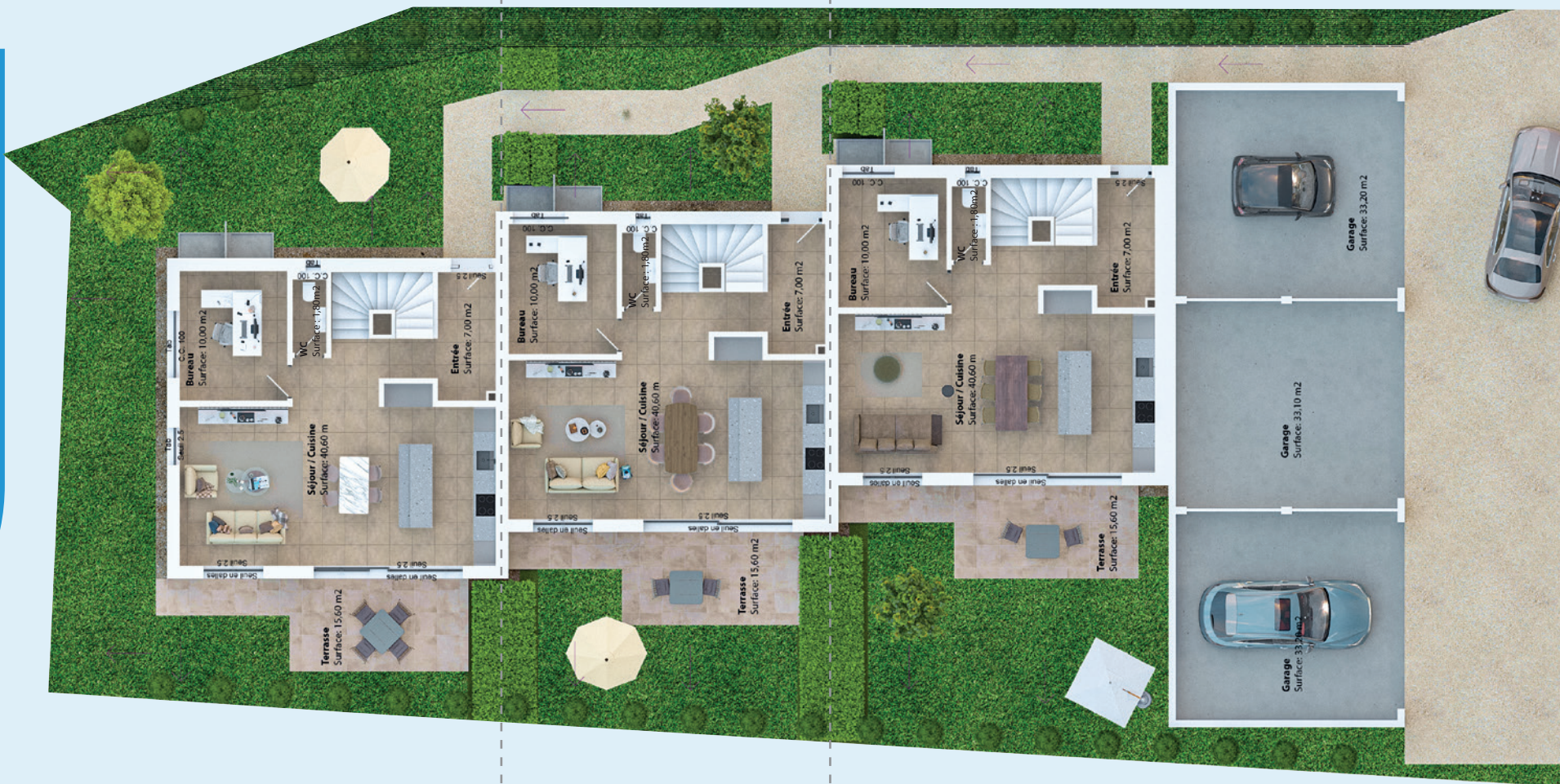
Villa A Rez-de-chaussée Surface PPE = 77.75 m 2